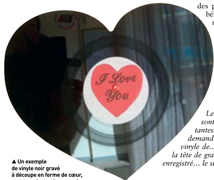
▲ Un exemple de vinyle noir gravé à découpe en forme de cœur, pour une demande en mariage ou une déclaration d'amour.