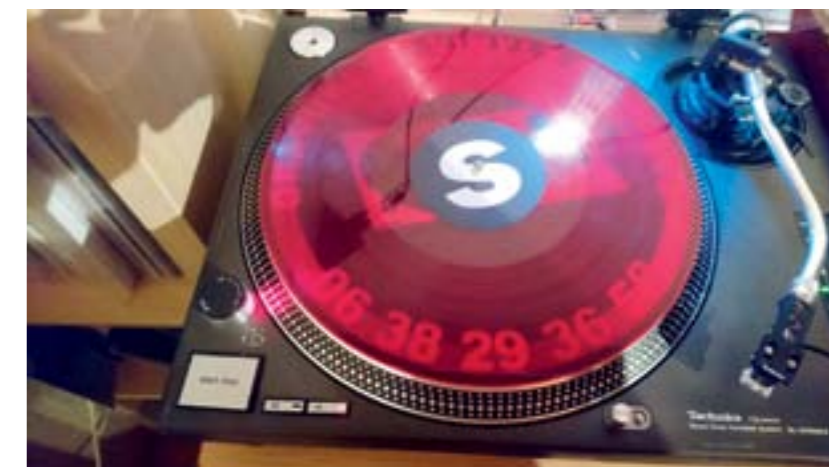
Maxi 45 tours de couleur sur une platine Technics pour l'écoute. ▼

Il faut ensuite passer à la gestion mécanique, faire avancer le stylet de gravure sur le vinyle, assurer l'avancement de la tête sur le disque afin que, pendant la gravure, le sillon ne touche pas la partie déjà gravée. Le processus se poursuit bien entendu sans interruption. Sur la platine, un second bras de lecture lit simultanément ce qui est en train d'être gravé. En cas de souci, le bras dégage de son axe. Donc la fiabilité de la gravure est certaine ; elle est, de plus, vérifiée en complément au microscope.