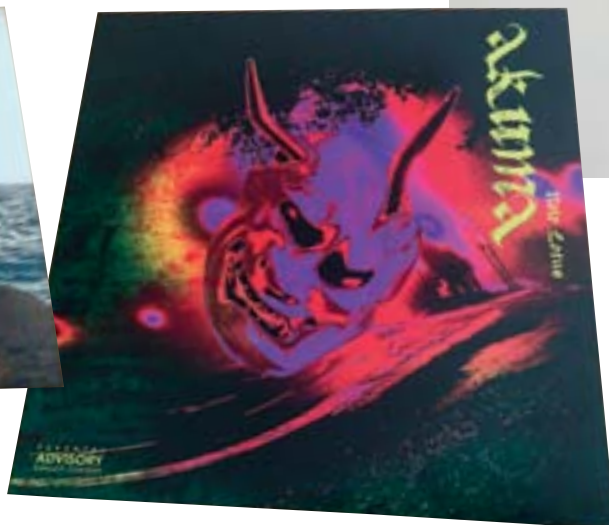
◀ Pochette réalisée pour un disque 12 pouces (30 cm).