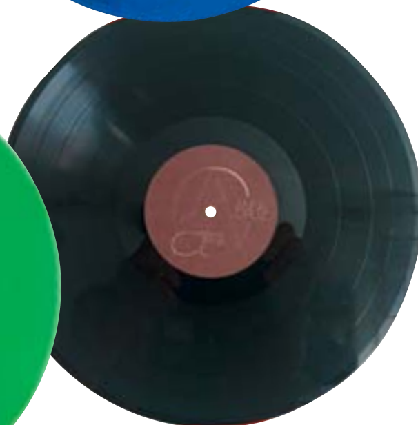
▲ Disque vinyle 12 pouces 30 cm, en version noire classique.