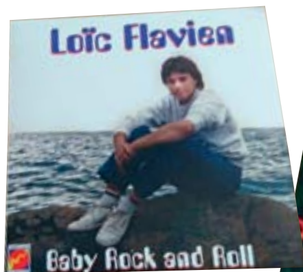
▲ Pochette réalisée pour un disque 7 pouces (45 tours).