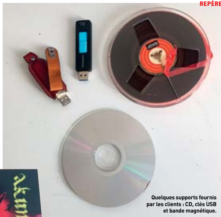
Quelques supports fournis par les clients : CD, clés USB et bande magnétique.

Pas besoin de se déplacer ; l'envoi de gros fichiers audio peut se faire via des sites spécialisés.