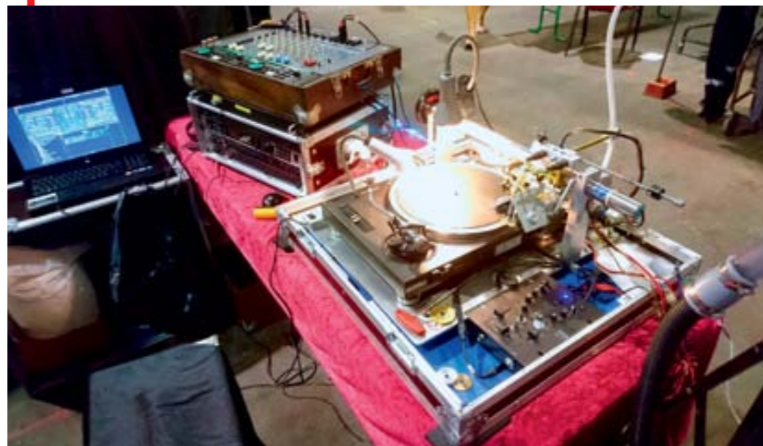
◀ Utilisée sur les salons, la graveuse portable accueille des fichiers sur clé USB et CD.