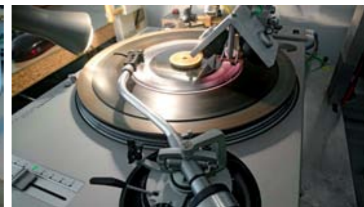
▲ ▶ La graveuse en action : le saphir lit le sillon gravé en amont. Elle est dotée d'une tête complexe sous le carter et d'un bras de lecture pour contrôler la bonne marche de l'opération et la restitution du son. Le gravage part de l'extérieur vers le centre.