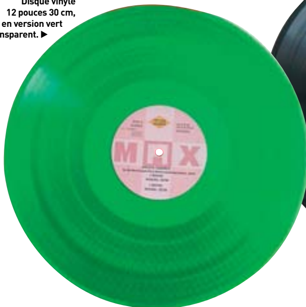
Disque vinyle 12 pouces 30 cm, en version vert transparent. ▶