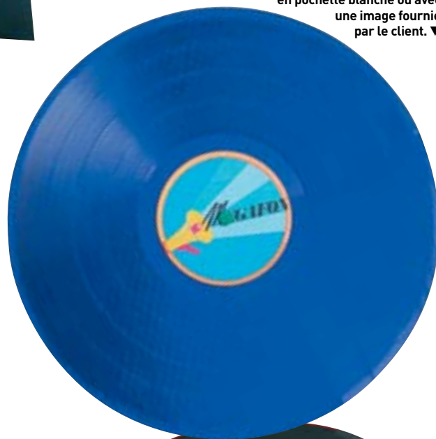
Un vinyle bleu gravé, avec son macaron central. Un produit fini, prêt à être livré en pochette blanche ou avec une image fournie par le client. ▼

▶ L'entreprise propose également de faire réaliser une pochette par un partenaire, à partir d'une photo fournie par le client. Il faut ajouter 10 € pour la pochette personnalisée d'un 45 tours.